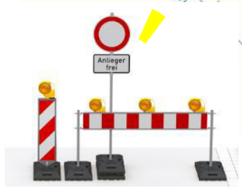
+ Zusatz (Anlieger frei & GVS Schönfeld – Triebendorf gesperrt)