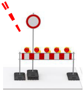
+ Zusatz (Anlieger frei & GVS Schönfeld – Triebendorf gesperrt)