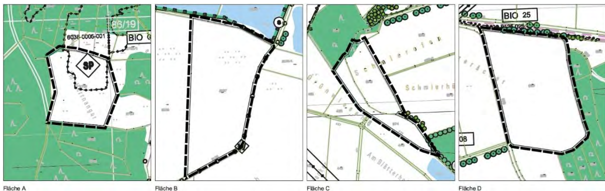
Abb. 2: Ausschnitt aus dem Flächennutzungsplan Markt Wiesau.

Der geltende Flächennutzungsplan stellt für alle vier Planflächen Flächen für die Landwirtschaft überwiegend dar. Die Darstellung eines Biotopes in Planfläche A ist inzwischen obsolet. Das ebenso in Planfläche A dargestellte Allgemeine Schwerpunktgebiet Naturschutz ist mit der Nutzung als Solarpark an dieser Stelle vereinbar.