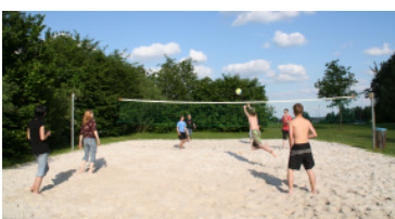
Freizeit an der „Kipp“!