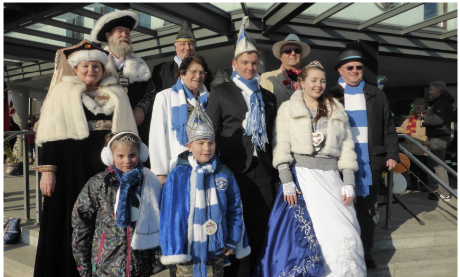
Ein gelungener Faschingszug 2015!

Schlüsselbund Herren-Ring Armketten einzelner Schlüssel