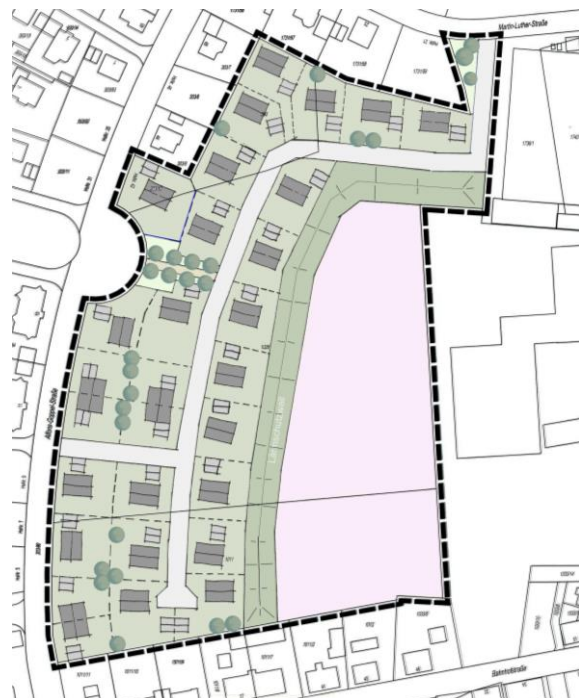
Gesamtkonzept zwischen Alfons-Goppel-Straße und Berufsschulzentrum