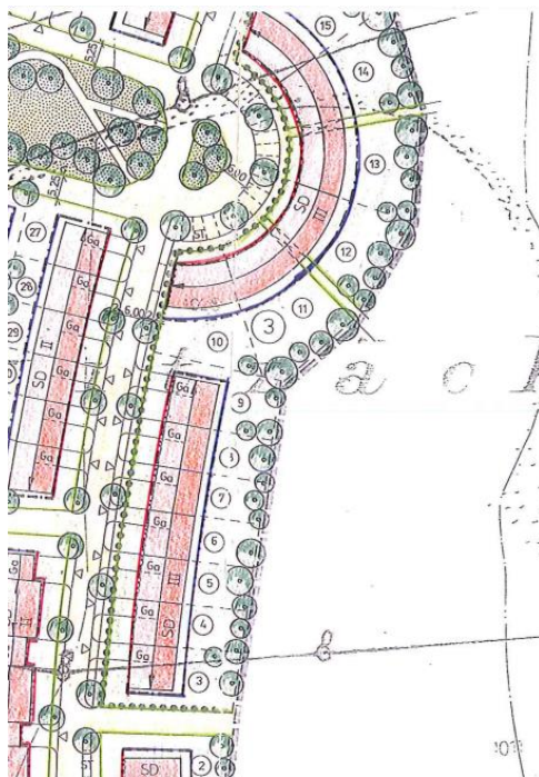
Ausschnitt aus Bebauungsplan „Nördlich Marktplatz“, Stand Oktober 1992

Insgesamt wurde bereits für den Bereich östlich der Alfons-Goppel-Straße und dem weiter östlich gelegenen Berufsschulzentrum ein städtebaulicher Entwurf als Gesamtkonzept (siehe unten rechts) für eine Bebauung erarbeitet. Der weitere Bereich soll in einem separaten Bebauungsplanverfahren aufgestellt werden. Die Anschlüsse an diesen Teil sind bereits in der vorliegenden 27. Deckblattänderung vorgesehen.